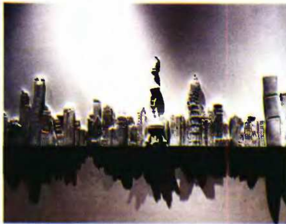
Έργο του Liu Jianhua.

Η Κίνα υπήρξε ο δεύτερος πόλος έλξης -μετά τις χώρες της πρώην Σοβιετικής Ένωσης- για την παγκόσμια αγορά της τέχνης που αναζητά συνεχώς νέα «προϊόντα»