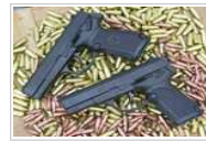
中国92式入选世界十大名枪